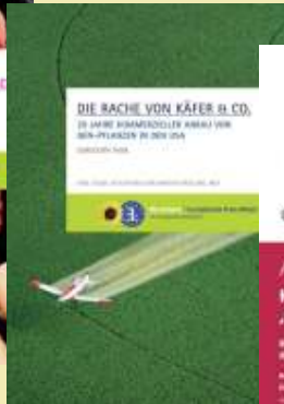
Gentec in USA